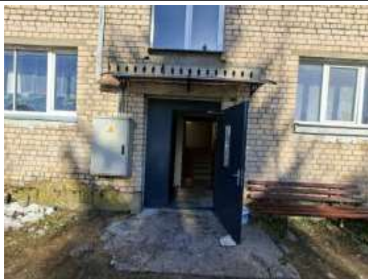
Ieeja kāpņu telpā