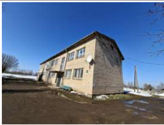
Dzīvojamā māja Brigi, "Jumtiņi"