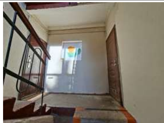
1.stāva kāpņu telpa