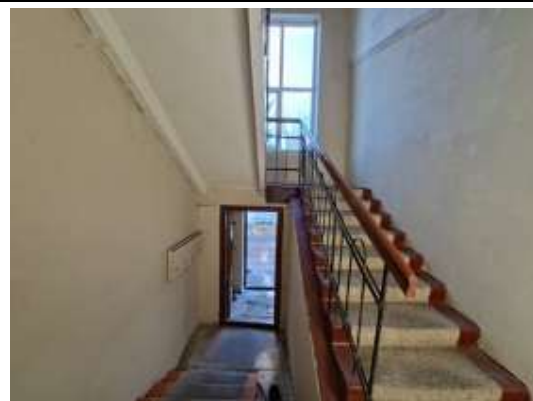
1.stāva kāpņu telpa