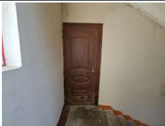
Dzīvokļa Nr.5 ieejas durvis