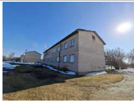
Dzīvojamā māja Brigi, "Jumtiņi"