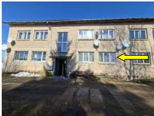
Dzīvokļa Nr.5 logi