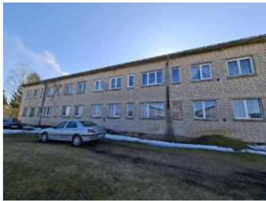
Dzīvokļa Nr.5 logi