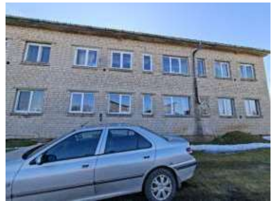
Dzīvokļa Nr.5 logi