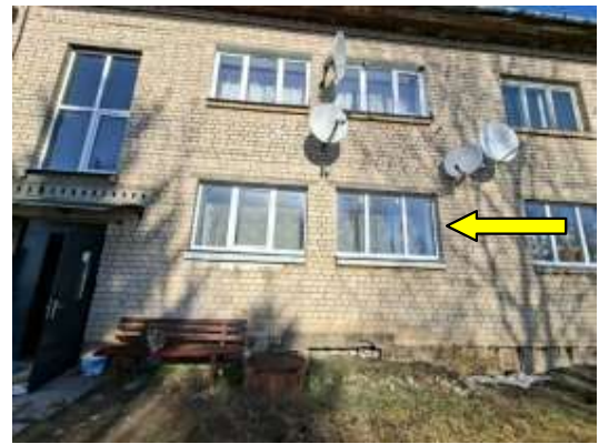
Dzīvokļa Nr.5 logi